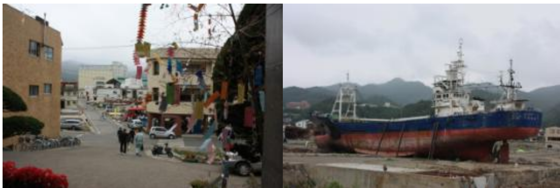
写真：釜石市役所の入り口から撮影、目の前は被災(左)／気仙沼市内には船が陸に(右)