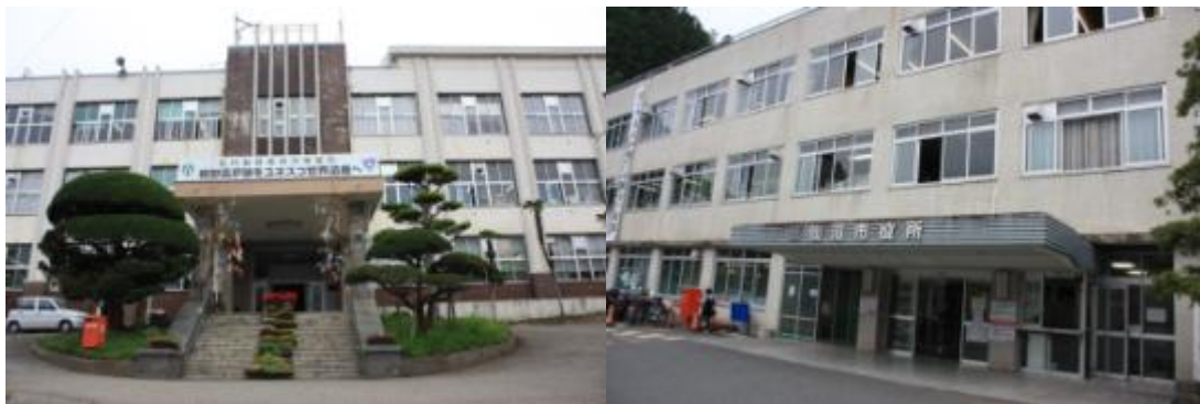
写真：釜石市役所(左)／気仙沼市役所(右)

両役所とも、比較的高い場所に立地しており、そのことが幸いして被災を免れた。特に、釜石市役所に関しては、目の前の建物が被災し、大きな損壊を被っており、この高さが大きな命運を分けたと言える。但し、震災当時に役所以外にいた職員やその家族は当然被災しており、中には亡くなった方もいる。