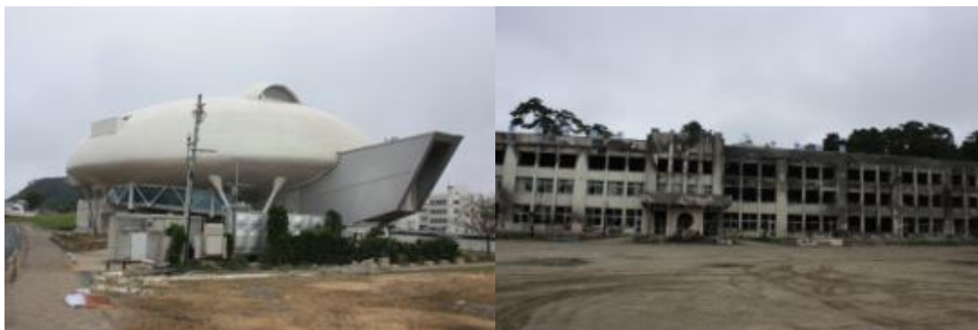
写真：一部損壊で済んだ石ノ森漫画館(左)／全損した門脇小学校(右)

名取市では、田んぼの中に多くの船やがれきが依然として残っていた。立ち入り禁止区域も多く、復旧の過程であることが伺えた。