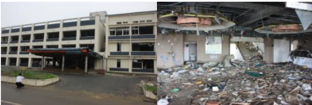
写真：被災した陸前高田市役所(左)／役所の中(右)