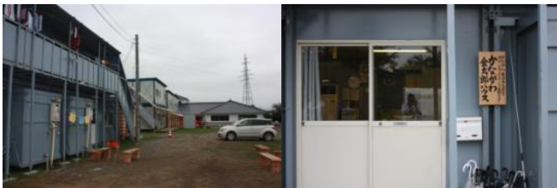
写真：手前が金太郎ハウス、奥は静岡県の施設(左)／金太郎ハウスの入り口(右)

施設内は、事務局及び共同スペースと3つの宿泊部屋(20名部屋1つと10名部屋2つ)があり、別棟に食事や会議をするスペースがある。プレハブ自体は、中古の素材を使用しており、2年間のリース料で700万円程度とのことであった。