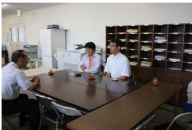
写真：石巻市議会事務局長と意見交換