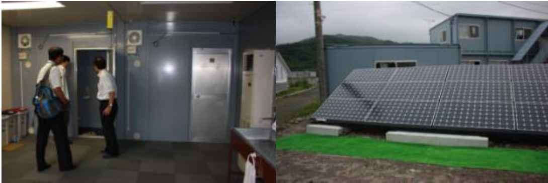
写真：施設内の風景、職員より説明を受ける(左)／ソーラーパネルを設置(右)