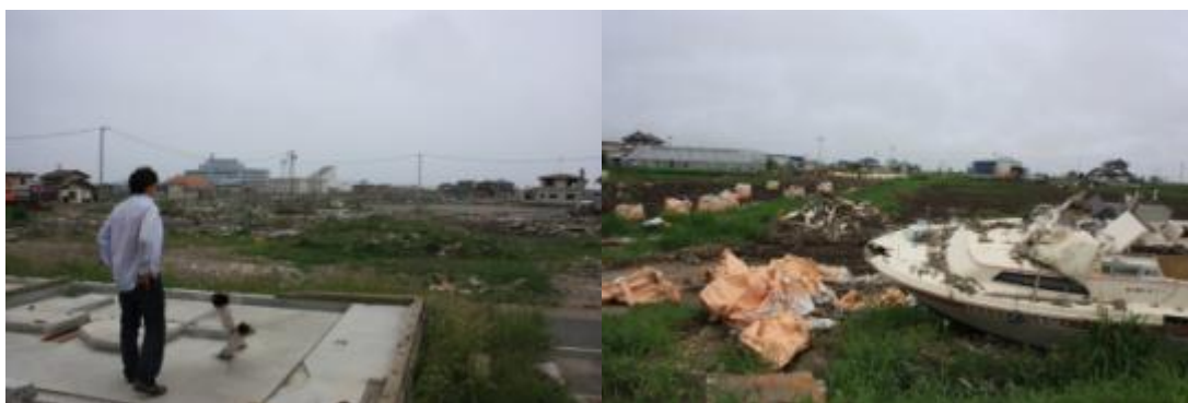
写真：門脇小学校前から臨む(左)／名取市の風景(右)